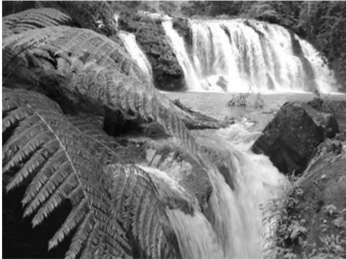
▲ Die zentralamerikanischen Fincas von Precious Woods (hier in Costa Rica) liessen sich zu einem späteren Zeitpunkt auch für einen sanften Tourismus nutzen.